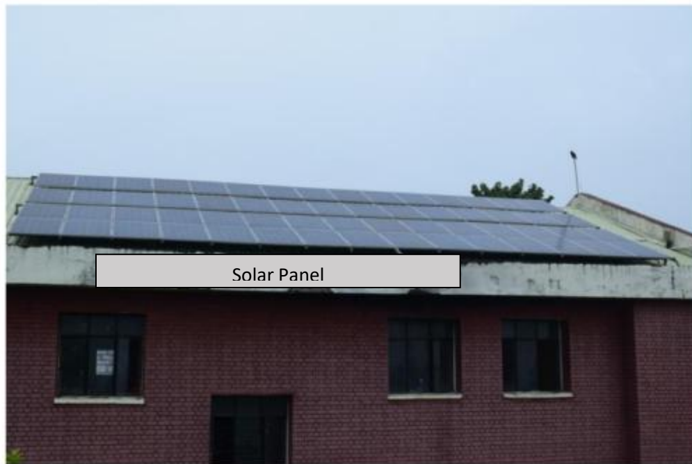
Figure 6 Solar Panel