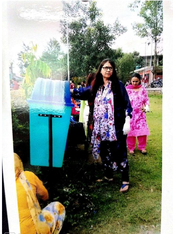
Figure 2 Staff and students on cleanliness drive