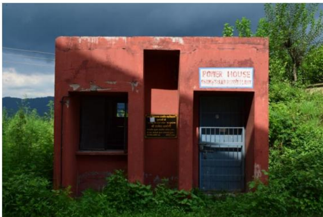
Figure 7 Solar Power House