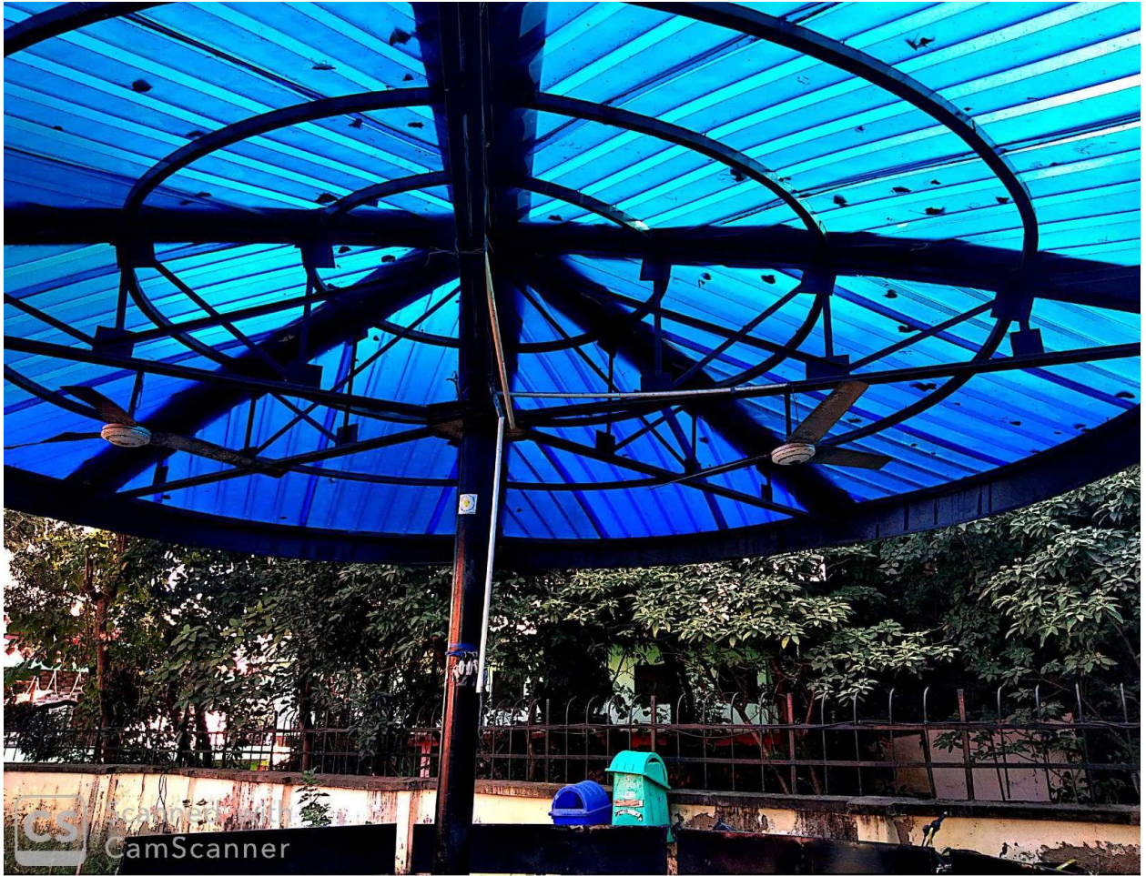
Figure 8 Use of Solar light to run fan in seating umbrella