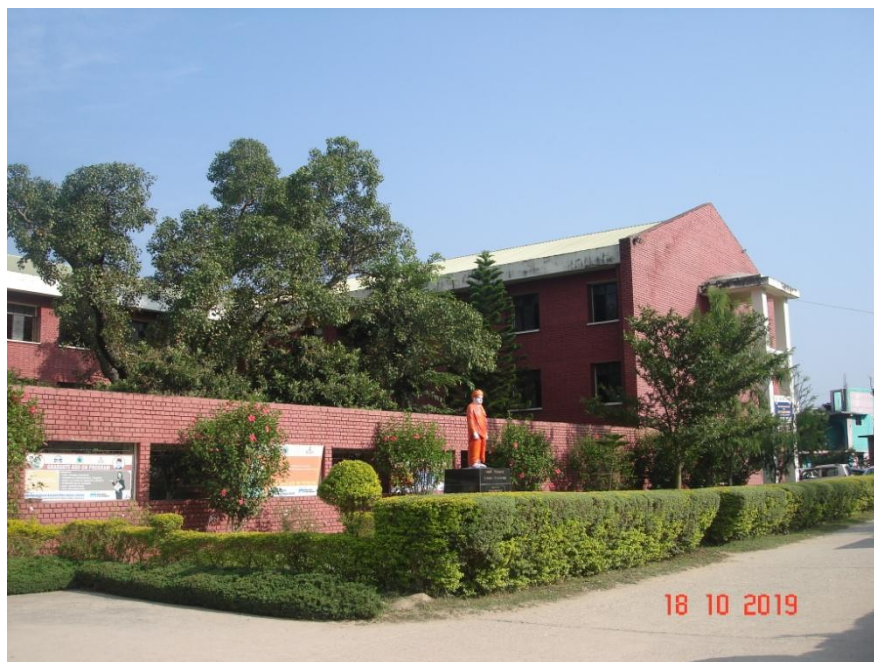
Figure 5 Lush green, neat and clean campus