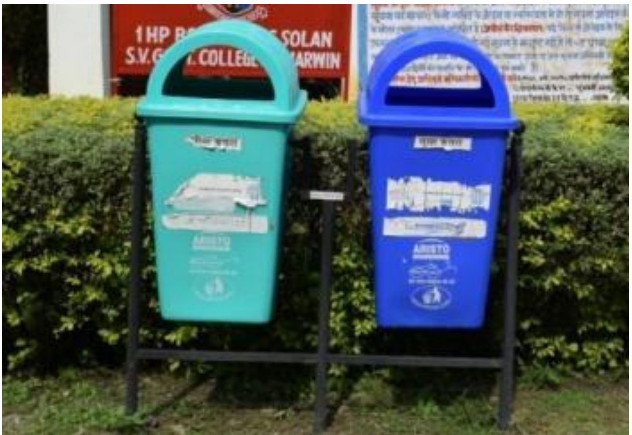
Figure 4 Separate dustbins placed for collection of wet and dry garbage