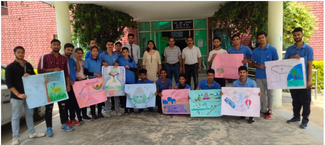
Figure 3 Poster Making Competition on Environment Conservation